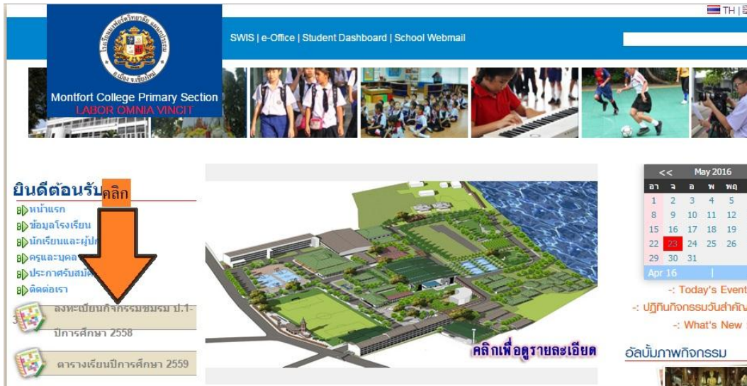
รูปที่ 1 จอภาพแสดงลิงค์การลงทะเบียนกิจกรรมชมรม

1. เข้าเว็บไซต์ของโรงเรียน www.mcp.ac.th จะพบกับลิงค์แจ้งการลงทะเบียนกิจกรรมชมรมเสริมหลักสูตร ดังรูปที่ 1