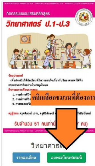
รูปที่ 3 แสดงการเลือกกิจกรรมชมรมที่สนใจ

a. เมื่อตัดสินใจเลือกกิจกรรมชมรมที่ต้องการแล้ว ให้คลิกลงทะเบียน ตรงตำแหน่งข้อความที่เขียนว่า “ลงทะเบียนชมรมนี้” โดยต้องเลือกให้ตรงกับกิจกรรมชมรมที่ต้องการ