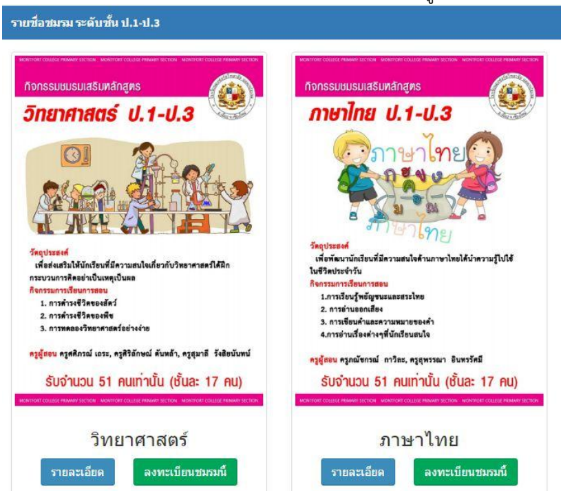
รูปที่ 2 จอภาพแสดงรายการกิจกรรมชมรม

2. เมื่อคลิกเข้าไปที่ลิงค์ดังกล่าว จะพบรายการกิจกรรมชมรมที่เปิดรับสมัครดังรูปที่ 2